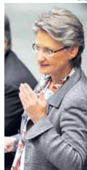
Ministerin Claudia Schmied: Bald mehr KMU

Österreich verfüge als Standortvorteil nicht wie andere Länder über Rohstoffe, sondern über eine hohe Innovationskraft seiner Unternehmen. Dies betreffe nicht nur den Bereich Forschung, sondern sämtliche Produktionsebenen eines Betriebes bis zum Marketing. „Innovation ist die Kernaufgabe von Betrieben, um neue Märkte zu erschließen und nachhaltig erfolgreich zu sein“, sagte Schmied. In Zukunft wird es mehr Klein- und Mittelunternehmen geben, da Konzerne immer mehr Bereiche auslagern. Dies betreffe beispielsweise Reinigung, Buchhaltung, Design oder Marketingaktivitäten.